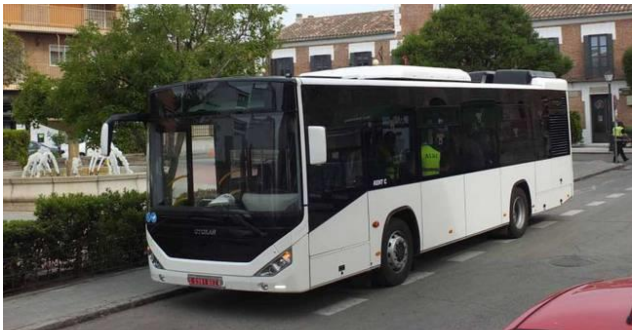
Imagen de archivo de un autobús urbano

Un medio de transporte que volverá a estar operativo en esta localidad de Ciudad Real, a través de la adquisición de dos vehículos eléctricos