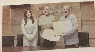
EL AYUNTAMIENTO Y CRUZ ROJA RENUEVAN SU CONVENIO ANUAL

EL AYUNTAMIENTO REALIZA ESTA ACTIVIDAD GRACIAS A LA DIPUTACIÓN Y A LA ASOCIACIÓN "DUELOS Y QUEBRANTOS", COLECTIVO QUE TIENE UNA EXPOSICIÓN EN EL CANAL