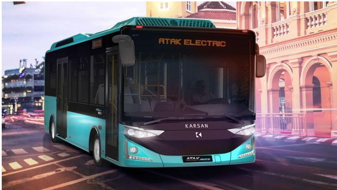
Autobuses urbanos eléctricos en Valdepeñas en 2023

La inversión asciende a 842.160 euros, cofinanciados por la Unión Europea con Fondos Next Generation EU