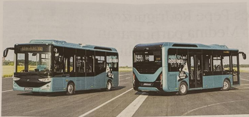
MODELOS DE LOS DOS AUTOBUSES URBANOS ELÉCTRICOS QUE ADQUIERE VALDEPEÑAS / LANZA