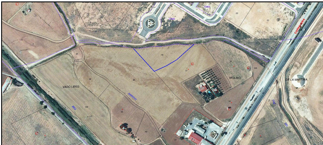
Imagen extraída de la Web del Catastro de la Parcela 78 Polígono 163.

Linda: Norte , parcela número 82 propiedad del Sepes y el Caz de la Veguilla; Sur , parcela número 77 propiedad de herederos de Petra Quintana López; Este , parcela 77 propiedad de citados herederos; y Oeste , parcela número 80 propiedad de los mencionados herederos. Es la parcela 78 del polígono 163. Referencia catastral: 13087A163000780000FG.