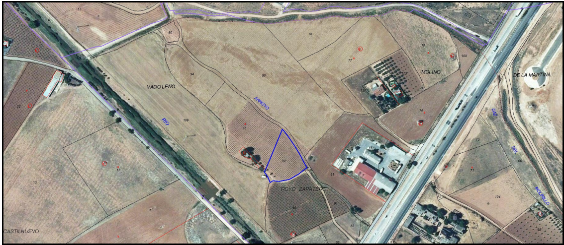
Imagen extraída de la Web del Catastro de la Parcela 92 Polígono 163.

Plaza de España, 1 13300 VALDEPEÑAS (Ciudad Real) Tel.902310011 Fax.926312634 www.valdepeñas.es