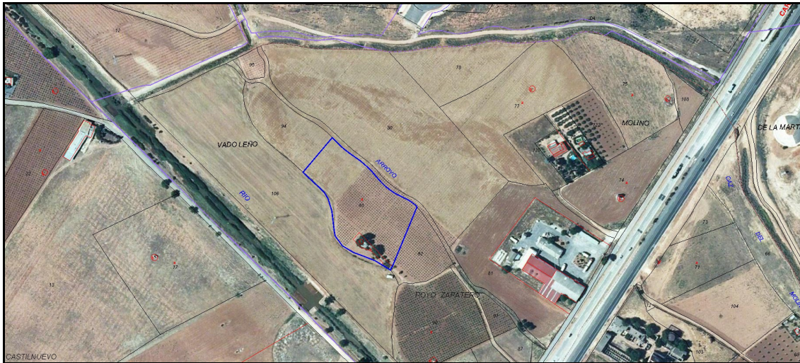
Imagen extraída de la Web del Catastro de la Parcela 93 Polígono 163.