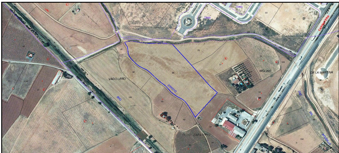
Imagen extraída de la Web del Catastro de la Parcela 80 Polígono 163.

Son las parcelas 80 y 92 del polígono 163. Referencias catastrales: 13087A16300080000FY y 13087A163000920000FK.